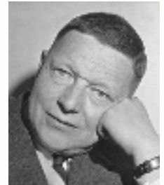
Carl Pott (1906–1985) führte mit seinen Entwürfen die väterliche Besteckmanufaktur in Solingen zum Erfolg