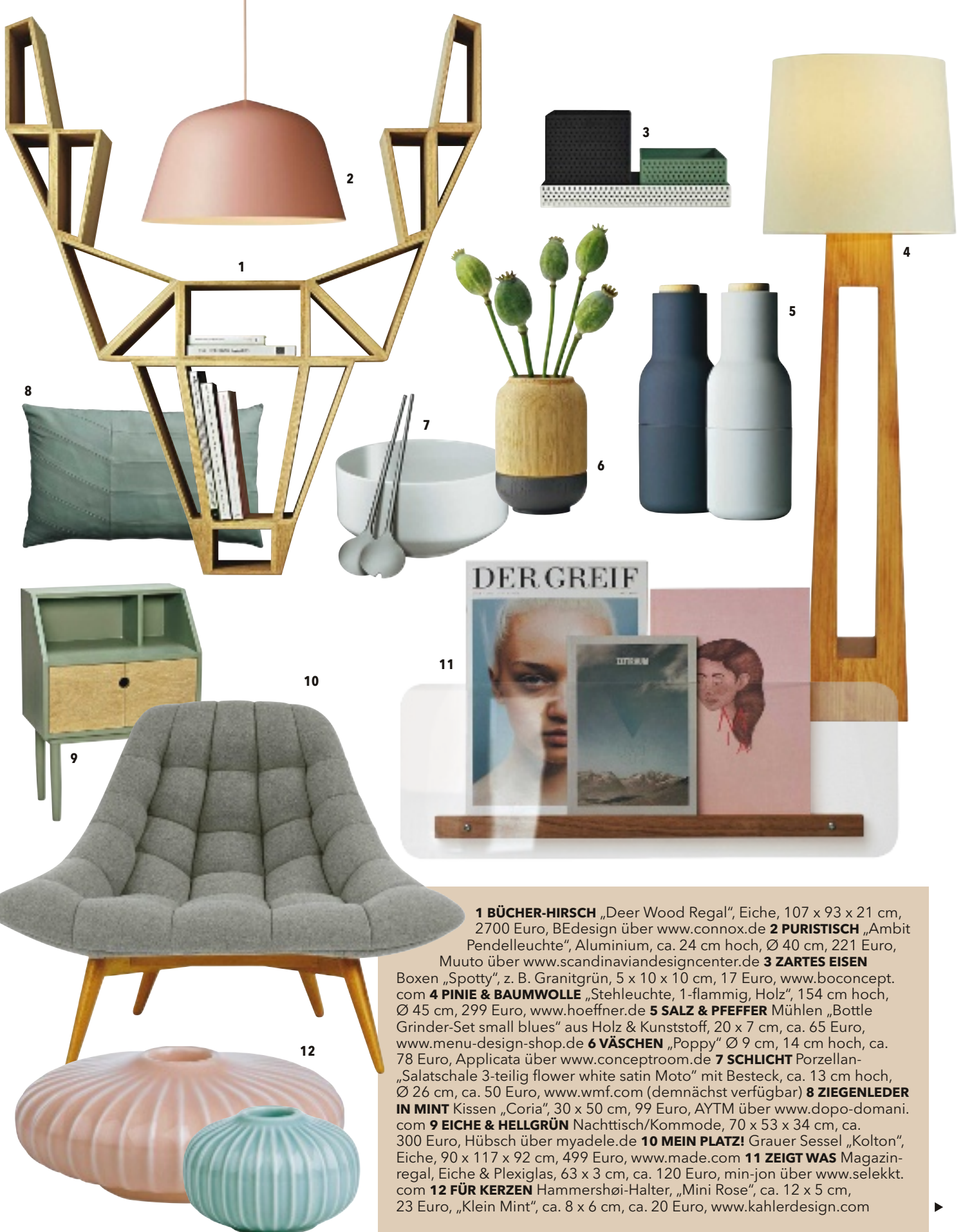
1 BÜCHER-HIRSCH „Deer Wood Regal“, Eiche, 107 x 93 x 21 cm, 2700 Euro, BEdesign über www.connox.de 2 PURISTISCH „Ambit Pendelleuchte“, Aluminium, ca. 24 cm hoch, Ø 40 cm, 221 Euro, Muuto über www.scandinaviandesigncenter.de 3 ZARTES EISEN Boxen „Spotty“, z. B. Granitgrün, 5 x 10 x 10 cm, 17 Euro, www.boconcept.com 4 PINIE & BAUMWOLLE „Stehleuchte, 1-flammig, Holz“, 154 cm hoch, Ø 45 cm, 299 Euro, www.hoeffner.de 5 SALZ & PFEFFER Mühlen „Bottle Grinder-Set small blues“ aus Holz & Kunststoff, 20 x 7 cm, ca. 65 Euro, www.menu-design-shop.de 6 VÄSCHEN „Poppy“ Ø 9 cm, 14 cm hoch, ca. 78 Euro, Applicata über www.conceptroom.de 7 SCHLICHT Porzellan-„Salatschale 3-teilig flower white satin Moto“ mit Besteck, ca. 13 cm hoch, Ø 26 cm, ca. 50 Euro, www.wmf.com (demnächst verfügbar) 8 ZIEGENLEDER IN MINT Kissen „Coria“, 30 x 50 cm, 99 Euro, AYTM über www.dopo-domani.com 9 EICHE & HELLGRÜN Nachttisch/Kommode, 70 x 53 x 34 cm, ca. 300 Euro, Hübsch über myadele.de 10 MEIN PLATZ! Grauer Sessel „Kolton“, Eiche, 90 x 117 x 92 cm, 499 Euro, www.made.com 11 ZEIGT WAS Magazinregal, Eiche & Plexiglas, 63 x 3 cm, ca. 120 Euro, min-jon über www.selekt.com 12 FÜR KERZEN Hammershøi-Halter „Mini Rose“, ca. 12 x 5 cm, 23 Euro, „Klein Mint“, ca. 8 x 6 cm, ca. 20 Euro, www.kahlerdesign.com