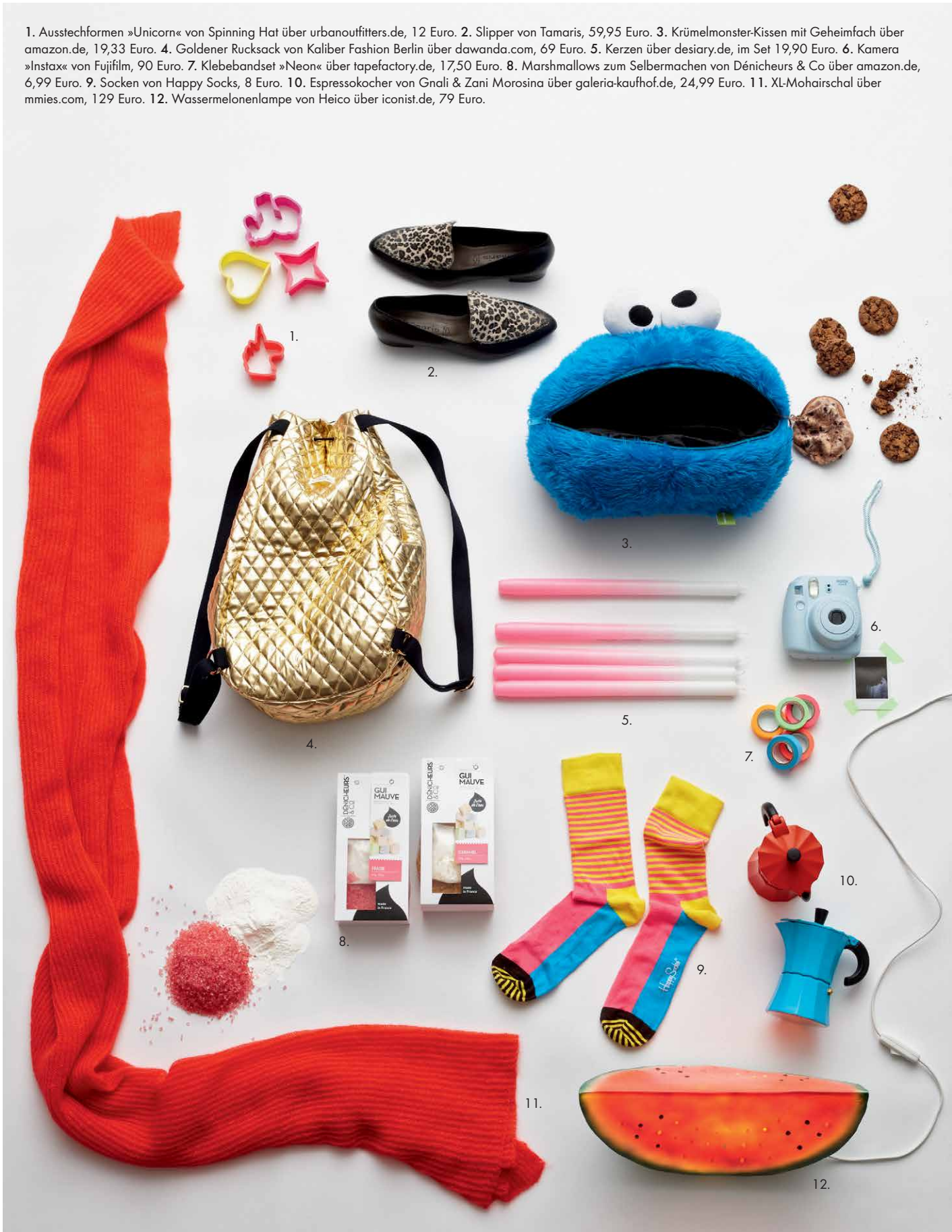
1. Ausstechformen »Unicorn« von Spinning Hat über urbanoutfitters.de, 12 Euro. 2. Slipper von Tamaris, 59,95 Euro. 3. Krümelmonster-Kissen mit Geheimfach über amazon.de, 19,33 Euro. 4. Goldener Rucksack von Kaliber Fashion Berlin über dawanda.com, 69 Euro. 5. Kerzen über desiary.de, im Set 19,90 Euro. 6. Kamera »Instax« von Fujifilm, 90 Euro. 7. Klebebandset »Neon« über tapefactory.de, 17,50 Euro. 8. Marshmallows zum Selbermachen von Dénicheurs & Co über amazon.de, 6,99 Euro. 9. Socken von Happy Socks, 8 Euro. 10. Espressokocher von Gnali & Zani Morosina über galerie-kaufhof.de, 24,99 Euro. 11. XL-Mohairschal über mmies.com, 129 Euro. 12. Wassermelonenlampe von Heico über iconist.de, 79 Euro.